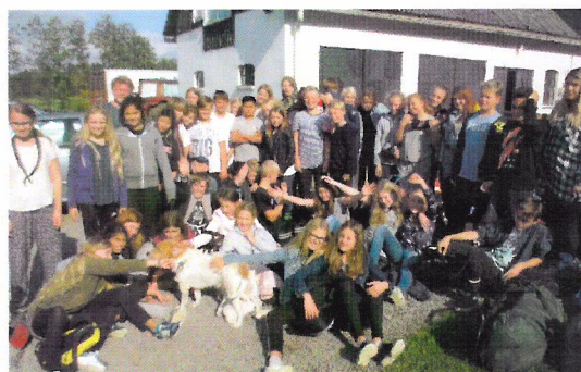
Det søde hold fra sidste år.

Lidt lomme penge (i danske kroner) må I dog selv sørge for.